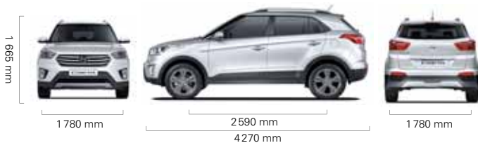
Version 1.4 L