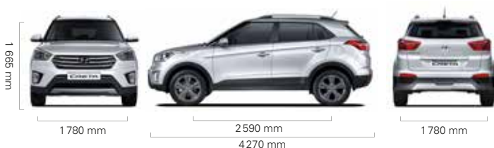
Version 1.4 L